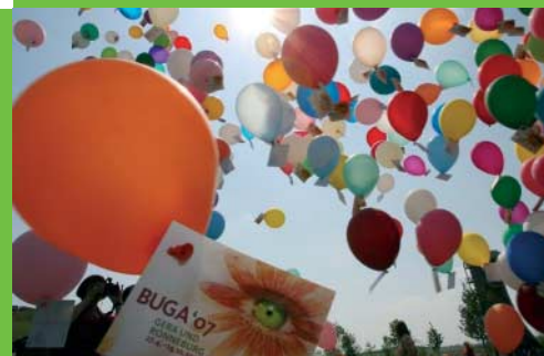
Begeistert: Über 25.000 Leute zeigen sich am »Tag der offenen Baustelle« sehr zufrieden. Kinder schickten 2007 Luftballons in alle Himmelsrichtungen