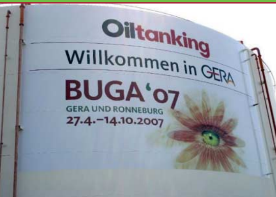
Mega-Folie mit großer Wirkung vor den Toren der BUGA-Stadt Gera