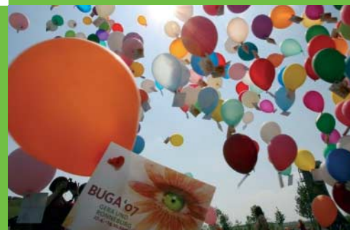
Begeistert: Über 25.000 Leute zeigen sich am »Tag der offenen Baustelle« sehr zufrieden. Kinder schickten 2007 Luftballons in alle Himmelsrichtungen