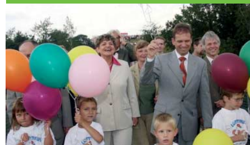
Brückenweihe: Ministerpräsident Dieter Althaus brachte mit Birgit Diezel und Volker Sklenar gleich zwei Kabinettskollegen mit