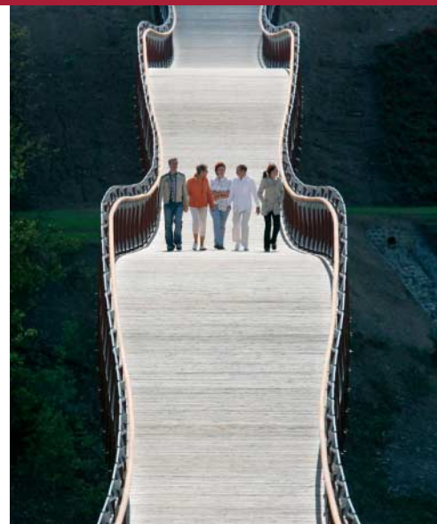
»Drachenschwanz«: Ein BUGA-Highlight geht um die Welt und sorgt für Furore