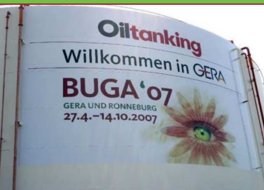
Mega-Folie mit großer Wirkung vor den Toren der BUGA-Stadt Gera